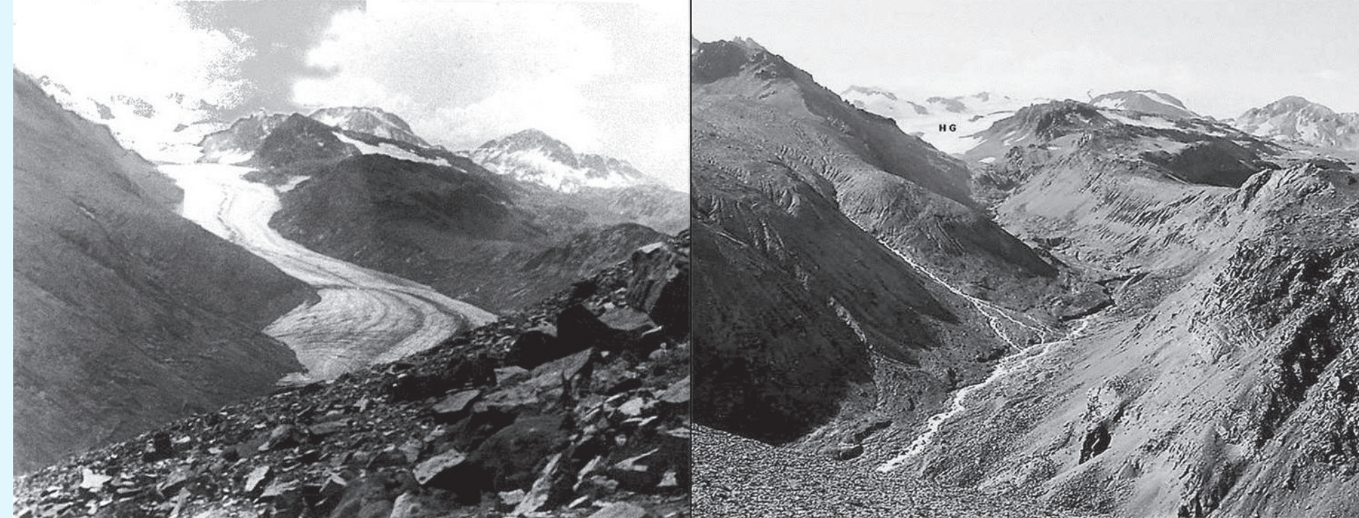
Vistas del glaciar El Humo, en la cuenca del Río Atuel.

La foto de la izquierda es de 1914, mientras que la de la derecha es de 1984. Brutal muestra del impacto del cambio climático en la masa de hielo.