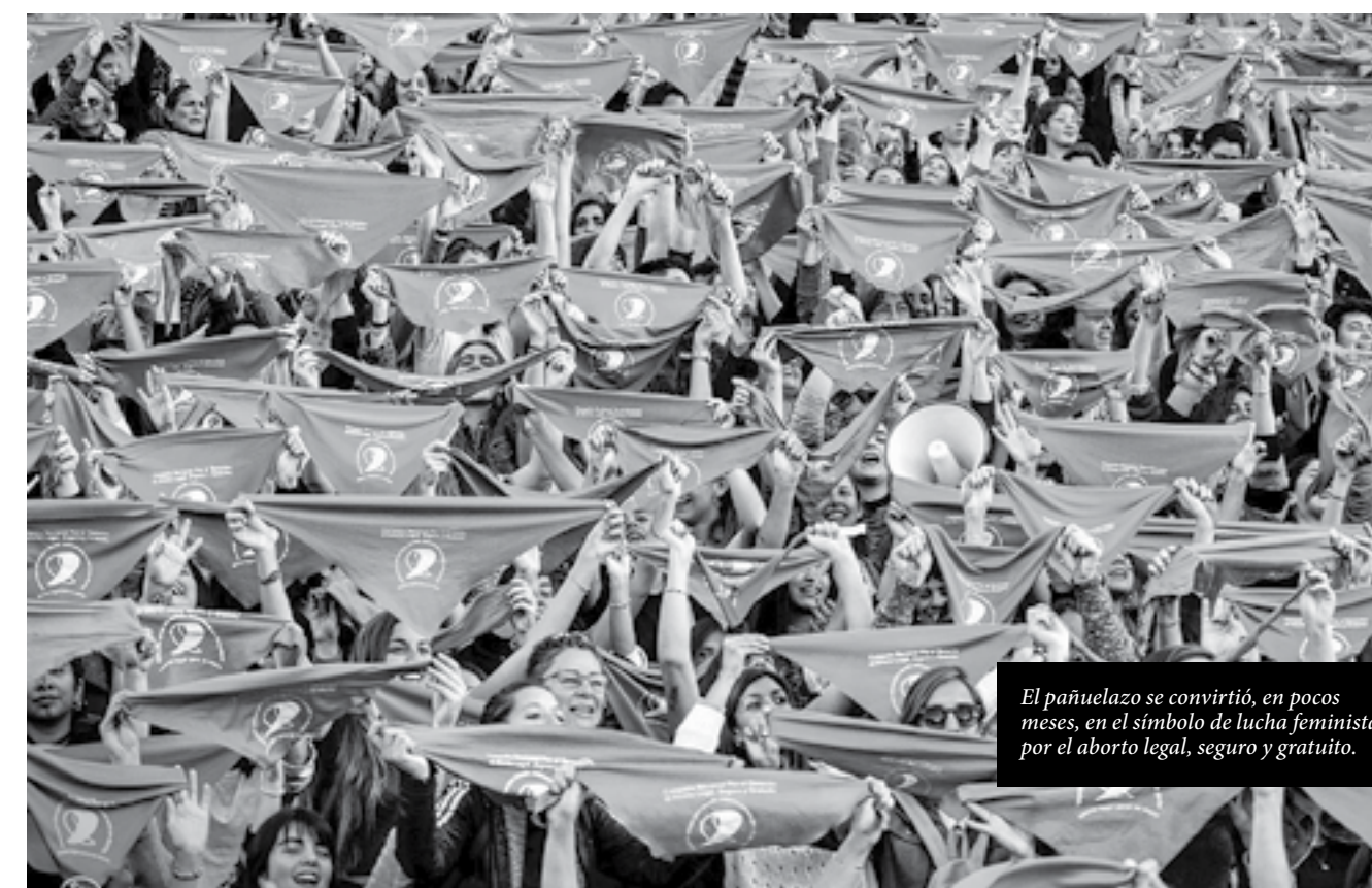
El pañuelazo se convirtió, en pocos meses, en el símbolo de lucha feminista por el aborto legal, seguro y gratuito.

A nivel masivo, profesionales y trabajadores de diversos ámbitos firmaron cartas abiertas a diputados y diputadas nacionales para que votaran a favor