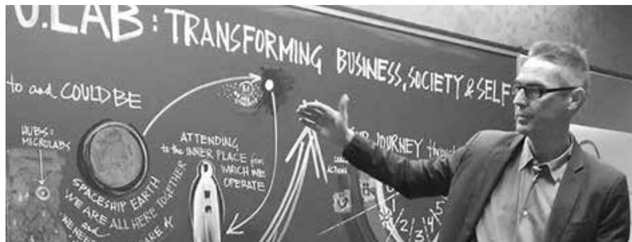
Otto Scharmer exponiendo su teoría