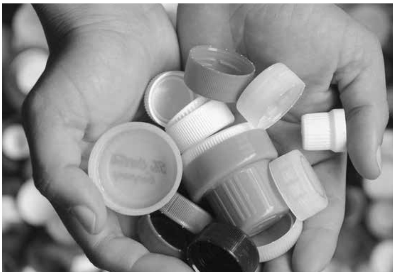
Además de lograr ganancias, las empresas B buscan generar valor social y ambiental.

Buscan cuidar la naturaleza y resolver problemas sociales para crear una nueva forma de negocio.